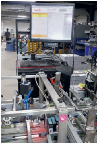
Das System von Twin-K vergleicht, personalisiert und überprüft eine Karte durch Datenbankgleich.

Zu den Maschinen-Investitionen gehörte 2019 die Anschaffung einer Rotationsstanze der Firma Bograma, aber auch viele Sonderlösungen wurden realisiert.