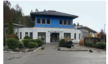
Am mrd-Firmsitz in Freudenberg im Siegerland wurde 2007, 2016 und 2019 nochmals angebaut. Heute arbeiten hier 60 Mitarbeiter.

Eine davon ist aus der jahrelangen guten Zusammenarbeit mit der Twin-K GmbH entstanden. Das Spezialisten-Team für Kuvvertiertechnik und Lesesysteme aus Pattensen löste das »Problem« des Vergleichens, Personalisierens und Überprüfens von Dokumenten und Karten, die bei mrd