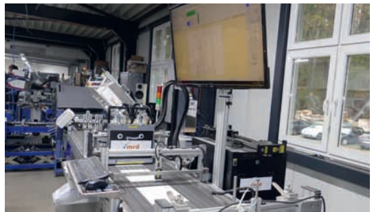
In der ersten Station wird die Seite bedruckt, die Personalisierung gelesen und der zweite Drucker angesteuert.